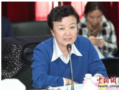
中国保健协会理事长秦小明